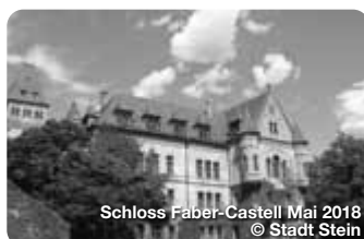
Schloss Faber-Castell Mai 2018

Ehem. Augustiner Chorherrenstift Das Kloster wurde 1409 von den Burggrafen von Nürnberg Johann III. und Friedrich VI. gestiftet. Zerstörung im Jahre 1460. Wiederaufbau bis 1468. Prinzregentenplatz 2, Langenzenn