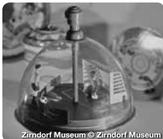
Zirndorf Museum