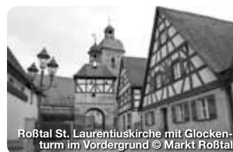
Roßtal St. Laurentiuskirche mit Glockenturm im Vordergrund

Wer an Stein denkt, dem fällt wohl zuerst Faber-Castell ein oder die B14 oder beides. Dabei hat die Stadt, die zwar am südwestlichen Rand Nürnbergs am linken Ufer der Rednitz liegt, aber zum Landkreis Fürth gehört, viel, viel mehr zu bieten. TreffpunktDeutschland.de/rosstal