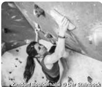
Zirndorf Boulderhalle

Naturlandschaft und Stadtfair – Landkreis Fürth entdecken. Im fränkischen Landkreis Fürth, beim Städtedreieck Nürnberg, Fürth und Erlangen gelegen, gibt es viele Erlebnisse zu entdecken. Auf den zahlreichen Rad- und Wanderwegen durch das bezaubernde Biberttal oder den verträumten Zenngrund lässt sich der Landkreis entdecken. Bei Schlechtwetter können sich Besucherinnen und Besucher den Indoor-Aktivitäten zuwenden. Genieß den Tag mit einem Spaziergang durch die historischen Räume des Faber-Castell Schlosses, mit Erholung in der Palm Beach Saunawelt oder mit einem Abend in den urigen Restaurants der Region. TreffpunktDeutschland.de/fuerth-landkreis