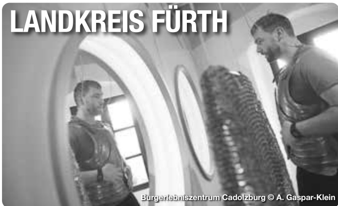
Bürgerlebenszentrum Cadolzburg

Alle Termine und Angaben unter Vorbehalt!