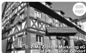
© ZiMa Zirndorf Marketing eG Tourist Information Zirndorf

Zu Zeiten seiner ersten urkundlichen Nennung, 954 n. Chr., hatte Roßtal bereits eine immense Bedeutung erlangt. Wer noch mehr Geschichte zum Anfassern erleben möchte, dem sei der Museumshof empfohlen. TreffpunktDeutschland.de/rosstal