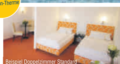
Beispiel Doppelzimmer Standard