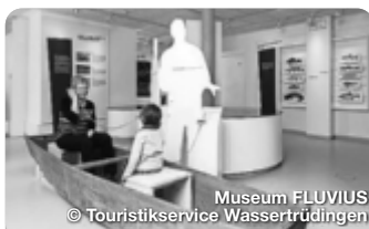
Museum FLUVIUS

Das Barockschloss der Fürsten ist Wahrzeichen der Stadt Schillingsfürst. Die Museumsräume und Parkanlagen weisen auf die Glanzzeiten einer kleinen fürstlichen Residenz hin. Am Wall 14, Schillingsfürst