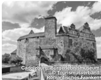
Cadolzburg Bürgerlebnismuseum

Alle Termine und Angaben unter Vorbehalt!