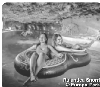
Rulantica Snorri