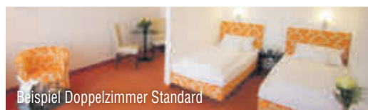
Beispiel Doppelzimmer Standard

Ihr Hotel ist knapp 3 km vom Ortskern entfernt. Es besteht aus zwei Gebäuden und bietet u.a. ein Restaurant, Terrasse und Aufzug. Die Poseidon-Therme (ca. 1.600 m²) mit Außenpool, Thermalbecken, Whirlpool u.v.m. erreichen Sie bequem über einen Bademantelgang.